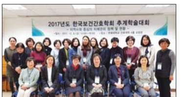
으로 추계학술대회를 개최한다. 학회 홍보를 활발히 하고, 대학원생 회원 확보 방안을 마련하기로 했다.

보건간호사회와의 긴밀한 협조체계를 구축하고, 교류 활성화에 힘쓰기로 했다. 대한보건협회의 공동