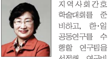
지역사회간호 학술대회를 준비하고, 한·일 공동연구를 수행 연구팀을 선정해 연구비를 지원하기로 했다.

학회는 회원 역량강화를 위해 학술대회를 연 2회 개최하고, 소규모 연구회 활동을 지원한다. 지역별 저널클럽을 4회 열고, 이와 함께 지역의 병원·대학·보건소 등을 견학할 계획이다. 2020년 한·일