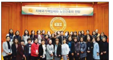
질 관리에 주력하기로 했다. 회원 확보를 위한 가입 독려 및 홍보에 적극 나서기로 했다.

추계학술대회는 '차세대가책임제와 노인간호의 전망' 주제로 열렸다. 주혜진 기자 hjoo@