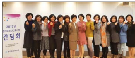
경기도간호사회가 추진하는 사업에 대해 적극적인 협력과 참여를 당부했다.

산하단체의 정책활동을 강화하고 지원하기 위해 마련됐다. 정책현안을 점검하고, 건의사항 등의 의견을 수렴하고, 대책방안에 대해 논의했다.