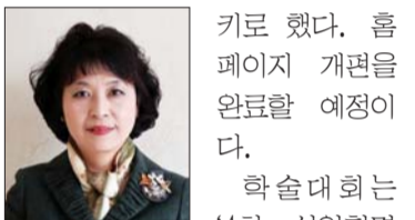
키로 했다. 홈페이지 개편을 완료할 예정이다.

학회는 회원역량강화에 주력하기로 했다. 국내·해외 교수임상연수 프로그램, 신입교수 세미나 및 워크숍 등을 개최하기로 했다. 올해 SCOPUS에 등재된 아동간호학회지 질 관리에 힘쓰기로 했다. 간호사 국가시험 문항개발 교육을 계속